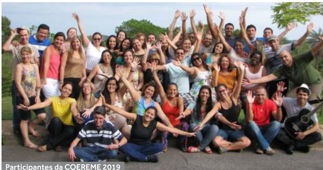
Participantes da COEREME 2019

Participem e divulguem! É sempre importante incentivarmos atividades como essa, sobretudo em um período em que as questões espirituais são menos valorizadas. Caso possam participar conosco no próximo ano, estaremos muito felizes com sua presença e agradeceremos todo esforço em propagar essa proposta de trabalho com Jesus a quantos for! Paz em Cristo!