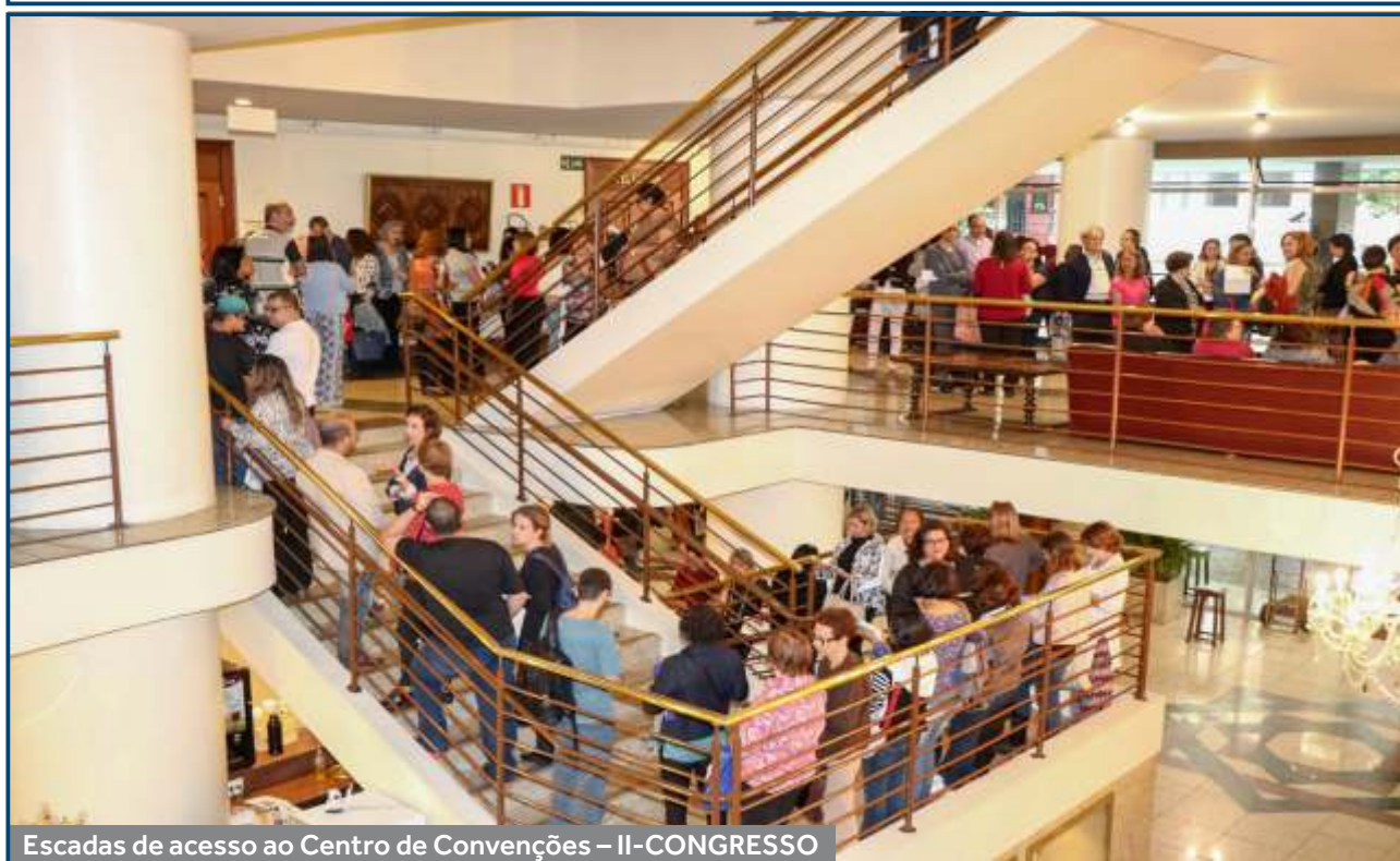
Escadas de acesso ao Centro de Convenções – II-CONGRESSO